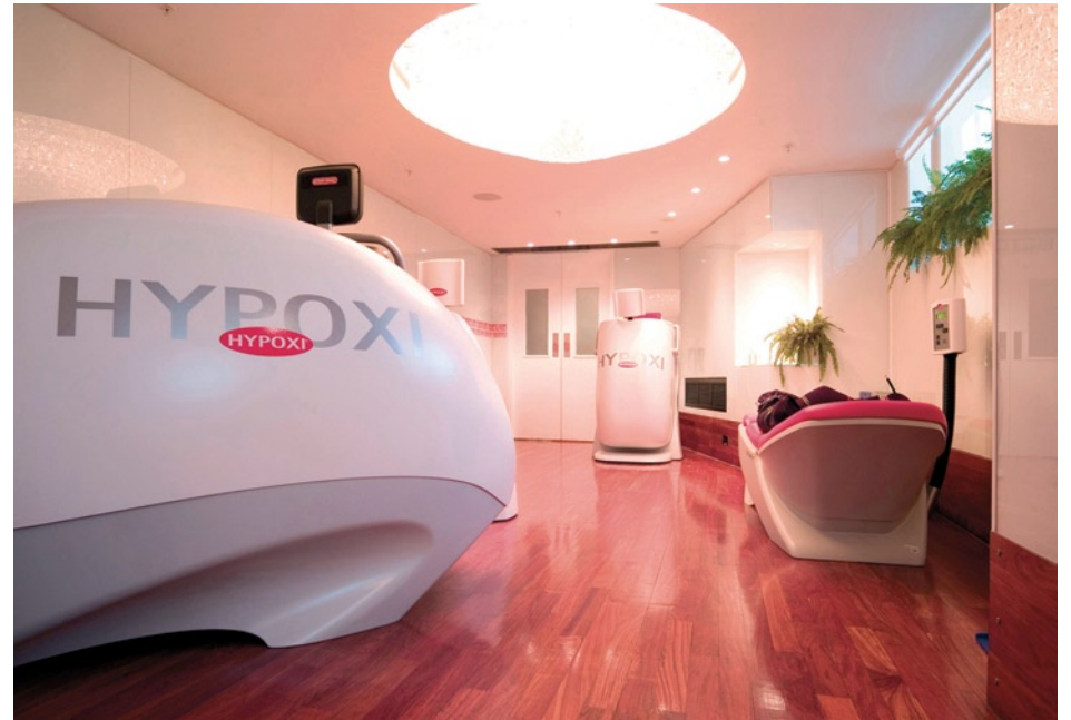
URBAN RETREAT DAY SPA, HARRODS VARUHUS, LONDON