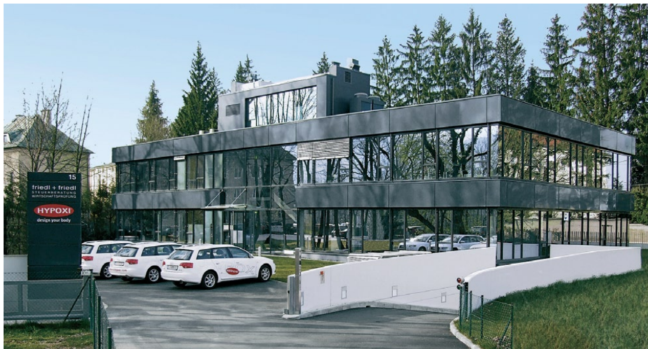
HYPOXI HUVUDKONTORET I SALZBURG, ÖSTERRIKE