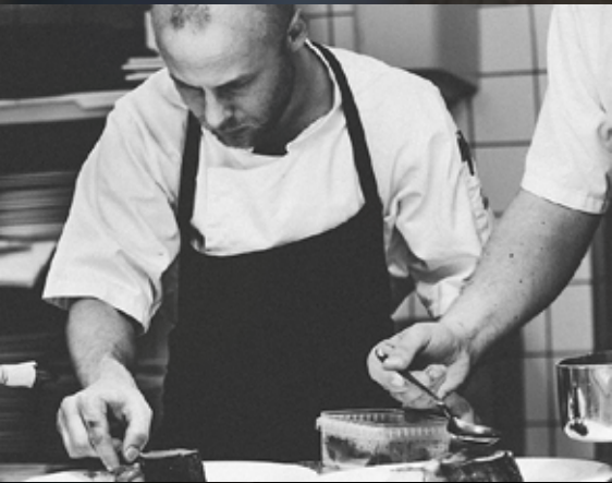
KOMPETENS & PRODUKTUTVECKLING