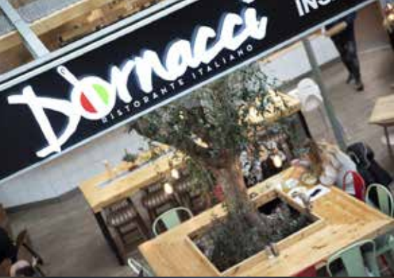
VARUMÄRKE & MILJÖ