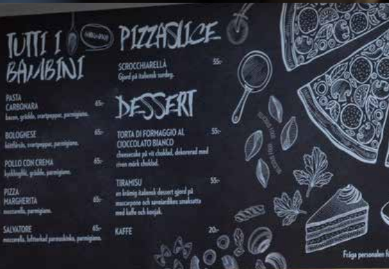
SORTIMENT, ERBJUDANDE & LEVERANTÖRSNÄTVERK